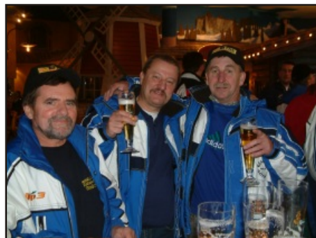
Fans - Altenmarkt/Zauchensee

seiner besten Witze zum Besten und die Schnürer Buam verstanden es ausgezeichnet gute Stimmung in die Runde zu bringen. Bei einem Abendessen in Stainach klang diese Fanclubfahrt gemütlich aus.