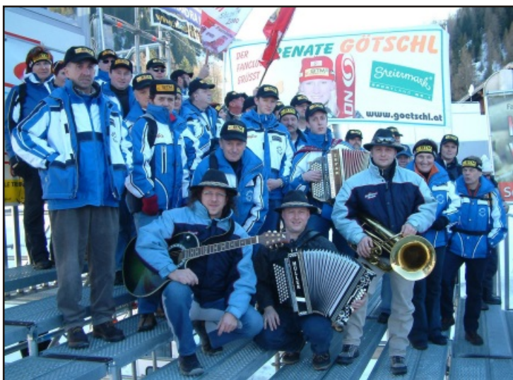
Fans beim Weltcuprennen in Altenmarkt/Zauchensee